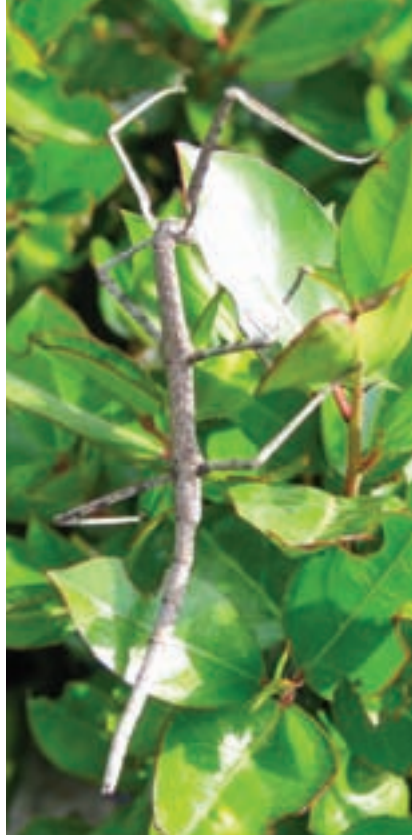
Akdeniz bölgemizde yayılış gösteren kanatsız bir çalı çekirgesi: Bacillus rossius