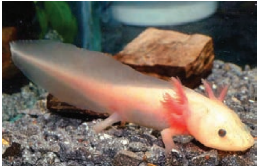
Neotenik bir canlı olan Ambystoma mexicanum

Semender örneği, Raff'ın 10 milyon yıl modeline uyuyor. Ancak, daha yakın tarihli bazı çalışmalar, bu zaman sı-