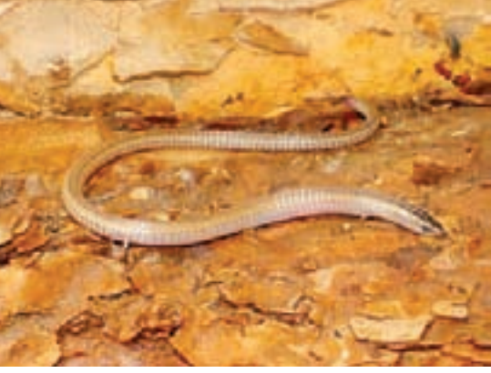
Güney Amerika kökenli bir kertenkele: Bachia

nırının dışında kalan örnekler açığa çıkmadı. Görünen o ki, öykünün tek kahramanı sessiz genler değil.