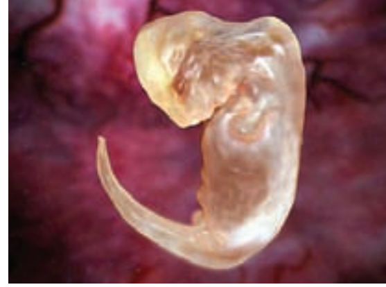
Yunus embriyosunda, gelişimin ilerleyen evrelerinde körelecek olan arka bacak çıkıntıları

Kuyruksuz ve kuyruklu kurbağaları (ya da alışıktığımız adlarıyla semenderleri) içeren ikiyaşamlılar (Amphibia) sınıfının adı, karasal yaşasalar bile yaşamlarının belirli bir evresinde suya bağımlı olmalarından geliyor. Bazı tropik kurbağa türleri haricinde, ikiyaşamlılarda üreme hücreleri suya bırakılıyor, yumurtalar suda dölleniyor ve suda gelişiyor. Kısa bir süre sonra, yumurtalardan sucul yaşayan larvalar çıkıyor ve belirli bir evrede de bu larvalar başkalaşım geçirerek, kara yaşamına uyum sağlamış erginlere dönüşüyorlar. Meksika ve Kuzey Amerika bölgelerinde yayılış gösteren semenderler de bu şekilde başkalaşım gösteren ikiyaşamlılar arasında. Ancak, aralarında birkaç tane istisna tür var. Bunlardan en meşhur olanıysa, hiç kuşkusuz axolotl ( Ambystoma mexicanum ). Metamorfoz geçirmeyerek yaşamı boyunca larva formunda kalan bu sevimli canlı, çok uzun zamandır bilim dünyasının ilgisini çekiyor. Araştırmacılar, önceleri bu canlının tek başına metamorfoz özelliğini yitirmiş olduğunu düşünüyorlardı. Ancak, semenderler üzerinde yapılan çalışmaların sayısı arttıkça, gerçeğin biraz daha farklı olduğu anlaşıldı. Sanılanın aksine, semenderlerin aile ağacı, bu grubun zaten metamorfoz yeteneğini kaybetmiş olan bir atadan geldiğini işaret ediyor. Yani, aslında aykırı olan durum, metamorfozun kaybedilmesi değil, yeniden ortaya çıkmış olması. Ayrıntılı incelemeler, gerçekten de metamorfozun 10 milyon yıl boyunca bu grupta sürekli olarak kay-