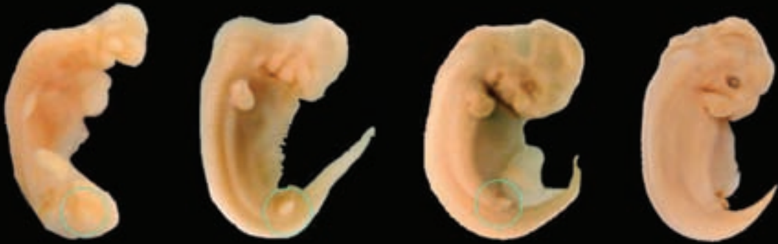
12. evre embriyo boy : 6,0 mm