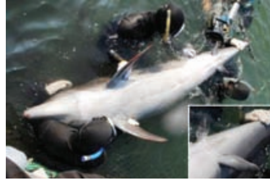
Japonya'da balıkçıların yakaladığı şişeburunlu yunus ve yunusun normal dışı pelvik yüzgeçleri

bolup yeniden ortaya çıktığını gösteriyor. Hatta, bilim insanlarına göre, bazı gruplarda metamorfozun kaybedilmesinin tek nedeni, kendilerinden köken alan gruplarda metamorfozun yeniden kazanılmasını sağlamak.